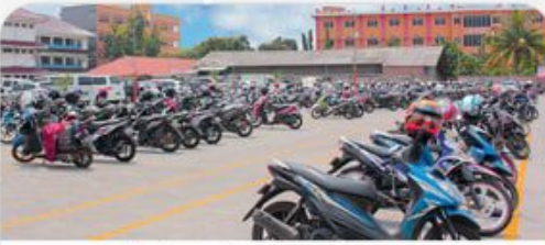
Lahan Parkir Motor