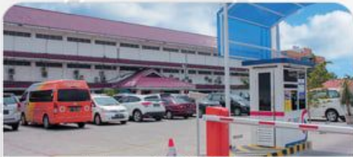
Lahan Parkir Mobil