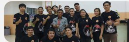
Self Defence Club